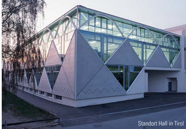
Standort Hall in Tirol