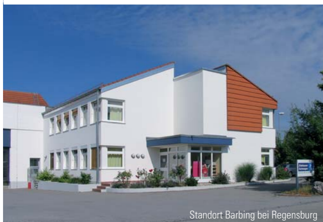
Standort Barbing bei Regensburg